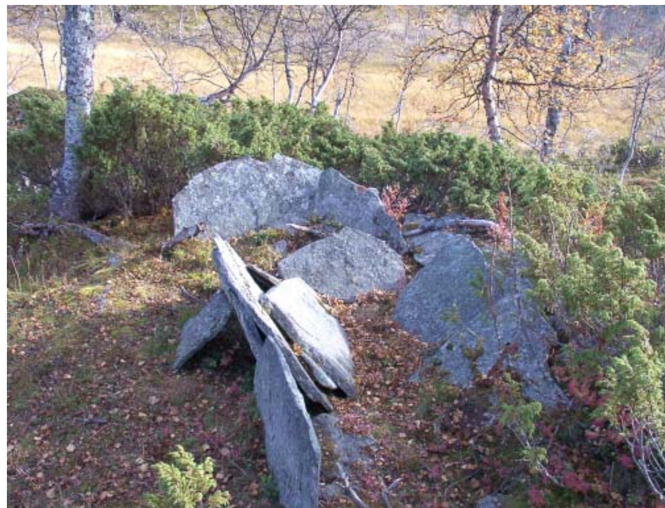
Skuggmannens grav, byggd av kantställda skifferhällor. The shadowman's grave, made of slate, placed edgewise.

En arkeologisk undersökning 1950 visade att den döde var lagd på marken, troligen i en akkja. Gravens botten var klädd med näver med akkjan ovanpå. Det skelettmaterial som hittades bortfördes till Nordiska museet i Stockholm. Analyser av skelettet visade att den döde var en 30–40 år gammal man som var 160 cm lång.