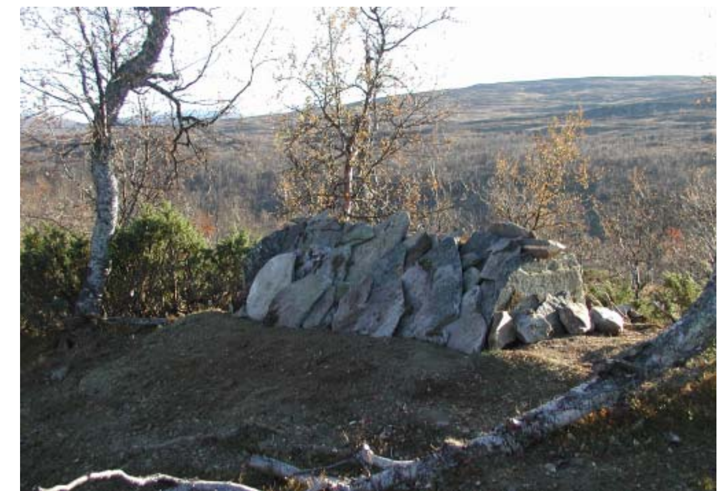
Bilden visar hur graven rekonstruerades efter undersökningen 2001. Fynden och benen har lagts samman med det övriga benmaterialet från Nordiska museet och återbegravts på sin ursprungliga plats. The picture shows the reconstruction of the grave after the investigation in 2001. The find and the bones have been placed together with the rest of the bone material from Nordiska museet, and has been reburied on the original site.

Offerplatser och gravar är exempel på fornlämningar i samiskt område. Det innebär att de skyddas av Kulturminneslagen. Den är till för att skydda vårt gemensamma kulturarv. Det är allas vår skyldighet att se till att generationer efter oss kan se och förstå hur människor levde förr.