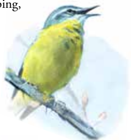
Gulärta ( Motacilla flava )

De betade strandängarna och vassbältet vid Leonardsberg lockar många fåglar. På våren översvämmas strandängarna och används av många flyttfåglar som rastplats. Från fågeltornet kan man se både brun kärrhök och fiskgjuse under häckningsperioden. Sydlig gulärta och sävsångare har en ovanligt hög revirtäthet i området och även arter som rördrom, årta, gråhakedopping, enkelbeckasin, snatterand och buskskvätta häckar här årligen. Småfläckig sumphöna hörs spela varje vår.