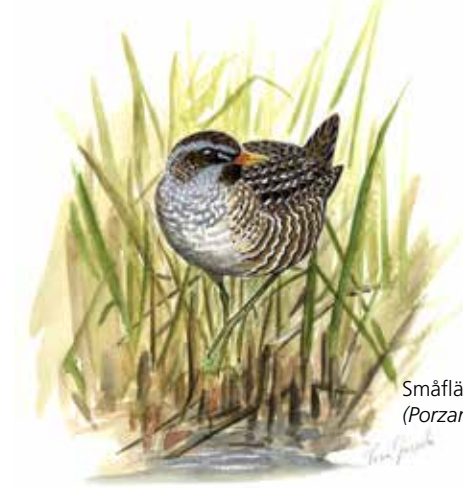
Småfläckig sumphöna ( Porzana porzana )

Området runt Leonardsberg är känt som en av landets hållristningsrikaste platser. Hållristningarna vittnar om att forntidens människor hade goda möjligheter att bo och livnära sig här. Motala ström var troligen en viktig vattenväg under bronsåldern.