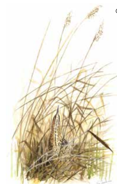
Rördrom ( Botaurus stellaris )

I området finns flera ihåliga ekar som är uppemot 500 år gamla. Ekarna är viktiga för många insekter. Här kan man hitta den sårbara skalbaggen läderbagge och andra insekter som blanksvart trädmyra och bålgeting. På de grova ekarna förekommer också många hotade lavar som gul dropplav, hjämbrosklav, grymig dagglav och vedsvampar som koralltaggsvamp och oxtungsvamp.