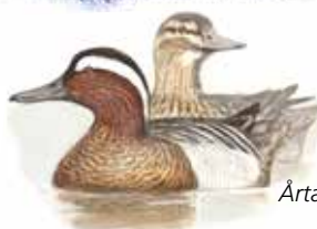
Årta ( Anas querquedula )

När inlandsisen rörde sig över landskapet drog den med sig stenar och block som skapade spår i berggrunden. Dessa spår kallas för isräfflor. På hällmarkskullen 600 meter sydväst om Leonardsbergs gård finns ett tiotal isräfflor som är ovanligt djupa. Att fårorna blivit så djupa beror på områdets relativt ”mjuka” bergart, glimmerskiffer, som har bildats ur leriga sediment.