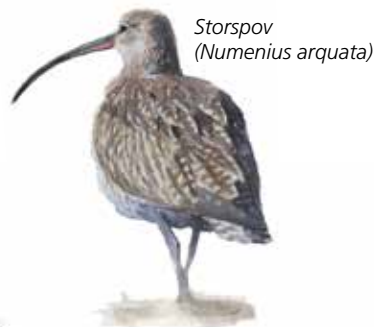
Storspov ( Numenius arquata )