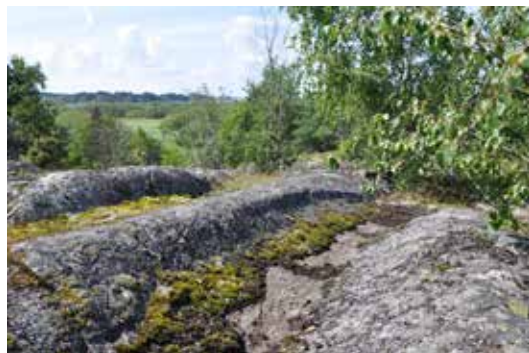
På en hållmarkskulle sydväst om Leonardsbergs gård finns det spår av inlandsisen i form av isräfflor.

Från Leonardsbergs gård utgår en vandringsled till isräfflorna, strandängarna, fågeltornet och hållristningarna. Leden består av två slingor och är sammanlagt cirka fyra kilometer lång.