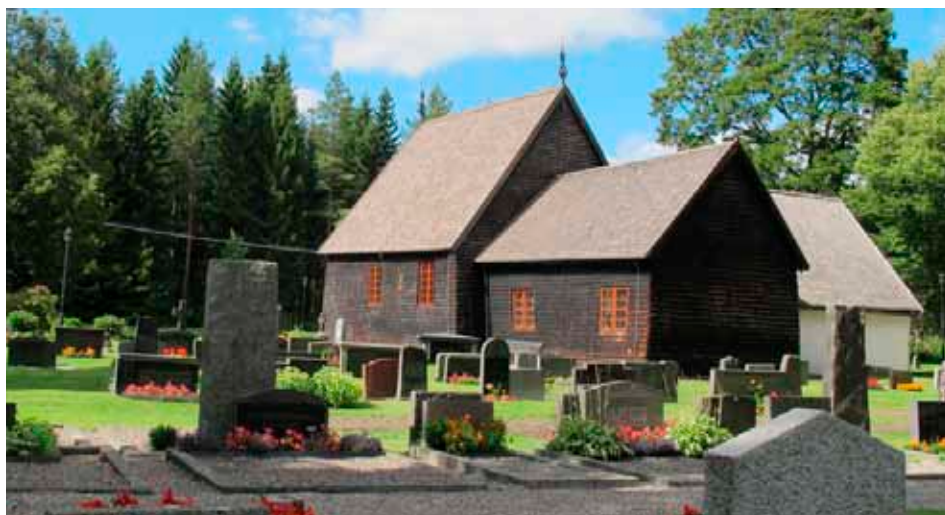
Tångeråsa kyrka. De äldsta delarna är från 1200-talet.

Skagershults gamla kyrka är från mitten av 1600-talet. Kyrkan är byggd i timmer och