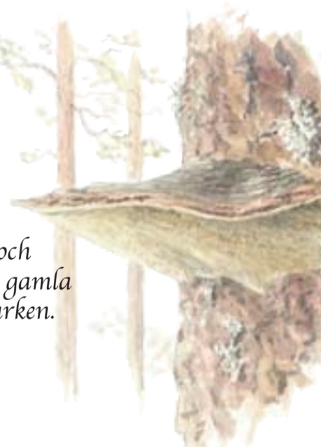
Tallticka är en parasit och växer endast på levande gamla tallar, ofta högt över marken.