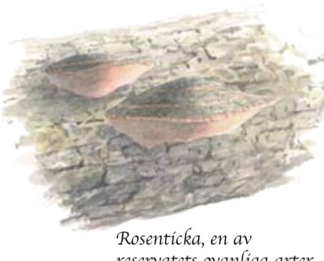
Rosenticka, en av reservatets ovanliga arter.