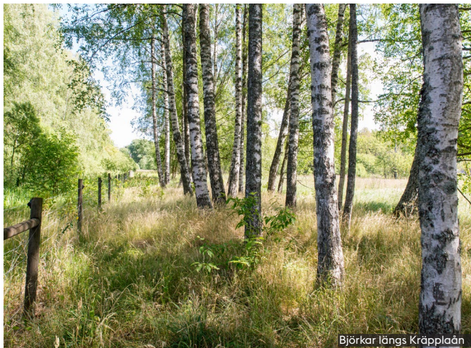
Björkar längs Kräpplaån

I anslutning till våtmarkerna förekommer partier med fuktig lövskog. I fuktlovskogen finns rikligt med död ved i olika förmultningsstadium. Den döda veden utgör en viktig livsmiljö för flera mossor, lavar, insekter och svampar. På liggande murkna trädstammar kan man hitta den sällsynta arten koralltaggsvamp. Fåglar och fladdermöss har ofta sina bohål i stående döda träd.