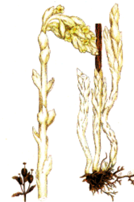
Tallört Monotropa hypopitys

Älg är vanligt förekommande i området, speciellt på myrarna i söder.