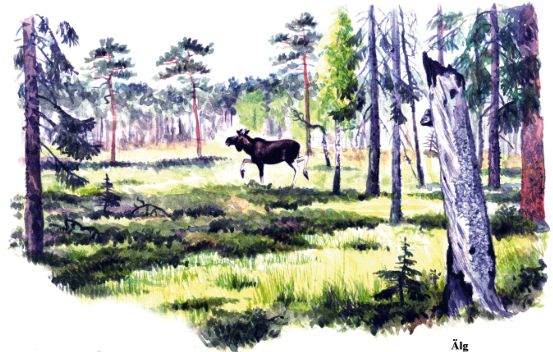
Älg Alces alces

Norrfäbodleden från Lumsheden är ett återupptagande av den stig som användes av vallkullorna då de på våren vandrade till fäbodlar längre norrut. Leden är markerad med blå färg, är ca 7 km lång och passar även en ovan vandrare. Den börjar vid Uvbergs Tjappan i Lumsheden (se skylt vid länsväg 880). Från de högsta höjderna kan man se Storsjön i Gästrikland. Iordningställare av leden är Lumshedens Viltvårdsområdesförening. Varje år i maj anordnas en fäbodvandring längs leden ( www.lumsheden.se ).