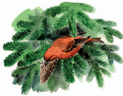
Mindre korsnäbb Loxia curvirostra kan ses i reservatet liksom...

Marken i reservatet ägs av Sveaskog. Reservatet förvaltas av Länsstyrelsen Östergötland som kan nås på adress: 581 86 Linköping, eller telefon 013-19 60 00. Se också www.e.lst.se .