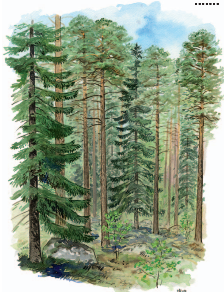
I reservatet finns tall- och granskog som är flera hundra år gammal.