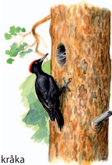
...spillkråka Dryocopus martius .