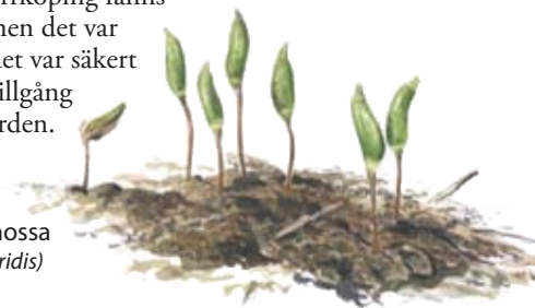
Grön sköldmossa ( Buxbaumia viridis )

Bärsjöskogen ligger utanför de forntida odlingsbygderna. Vid Bärsjöns sydspets ligger ett par torpställen, men Kolmårdsskogen är i allmänhet för mager och stenig för att odlas upp. På gamla kartor från 1800-talet framgår det att Bärsjöskogen tillhörde slättgårdarna i Ingelstad och Ståthöga. På slätten strax norr om Norrköping fanns bördig åkerjord men det var ont om skog, så det var säkert värdefullt att ha tillgång till mark i Kolmården.