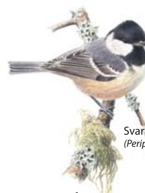
Svartmes ( Periparus ater (syn. Parus a. ))

Bärsjöskogen är en lite hemlighetsfull gammelskog i Kolmården. Skogen är orörd sedan länge och en fristad för mossor, lavar och svampar som hör urskogen till. Den som ger sig tid att vandra hit finner ett rofyllt granskogsdunkel och höga bergknallar med utsikt över Bärsjön och bort över ett grönt hav av barrskog.