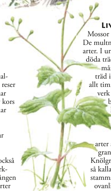
Dvärghäxört ( Circea alpina )

Bland svamparna som tar för sig av de döda granarna hittar vi lite ovanliga arter som ullticka. Den växer på liggande granar i områden med hög luftfuktighet. Knölgrynnna är en riktig sällsynhet. Den är en så kallad skinnsvamp som växer på multnande stammar av barrträd. Gullgröppa är en annan ovanlig skinnsvamp. Den kan du leta efter på undersidan av döda barklösa tallstammar och grova grenar.