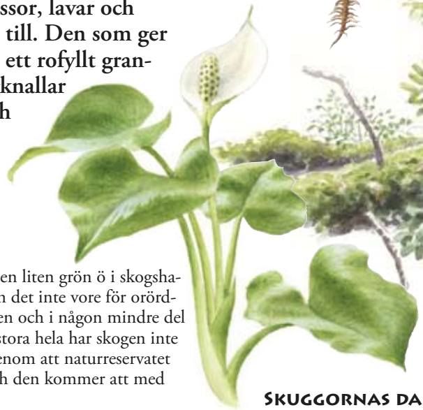
Missne ( Calla palustris )