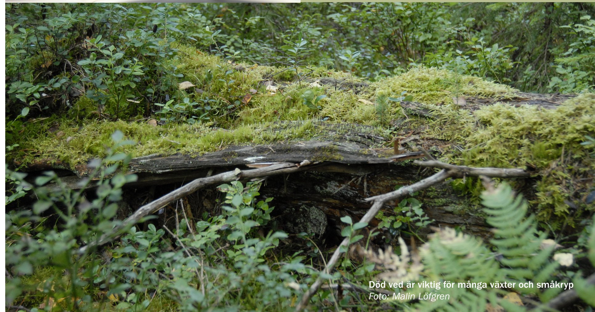
Död ved är viktig för många växter och småkryp

Tidigare häckade exempelvis rörhöna och smådopping varje år men dessa arter finns inte längre kvar. Nu hoppas vi att de kommer tillbaka! Du kanske kan bli först att återupptäcka några av dem! Rapportera i så fall gärna dem eller andra spännande djur eller växter på www.artportalen.se