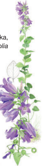
Hässleklocka, Campanula latifolia

På de högt belägna hållmarkerna dominerar tall och reservatet är ett av Östergötlands finaste och största områden med gamla tallar. Tittar du noga kan du se spår efter de sällsynta skalbaggarrelikterbock och svart praktbagge vars larver lever i den grova barken på solexponerade tallar. Dvärgbägarlav och tallticka är två andra arter som är beroende av gamla tallar för att överleva. Anledningen till att det fortfarande finns så många sällsynta arter kvar i Ågelsjöns skogar är att de inte har påverkats av storskaligt skogsbruk.