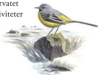
Forsärla, Motacilla cinerea

Ågelsjön är ett av de mest välbesökta naturreservaten i närheten av Norrköping. Här kan man vandra, paddla kanot, bada eller klättra. Branterna längs Ågelsjön är välbekanta hos klättrare över hela landet. För den som vill fiska finns bland annat gädda, abborre och lake i sjön men glöm inte att köpa fiskekort. Det finns flera markerade leder i reservatet. Vid Tallholmen ligger ett vindskydd och längs lederna finns grillplatser. Som besökare gäller det att vara försiktig med elden, släcka efter sig och bara elda på anordnade platser. Det finns även en tillgänglighetsanpassad slinga och vid badplatsen finns en badramp. Naturreservatet inbjuder till många olika aktiviteter och upptäckter men du behöver egentligen inte göra så mycket. Det räcker att ta en promenad och njuta av Ågelsjöns natur.