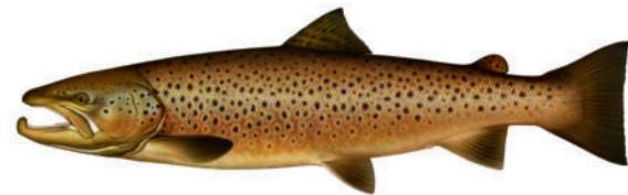
Öring, Salmo trutta