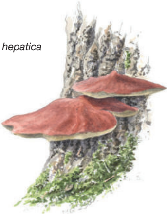
Oxtungssvamp, Fistulina hepatica