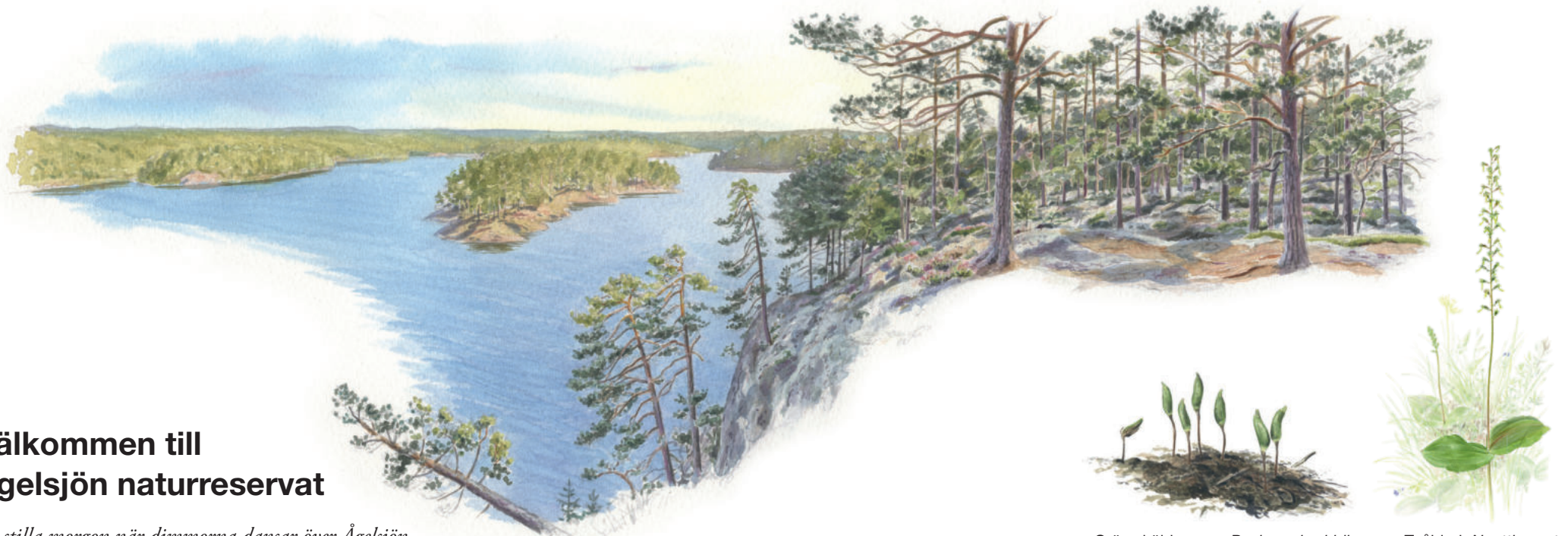
Grön sköldmossa, Buxbaumia viridis

Industriverksamheten vid Hultsbruk kom igång 1697. Då tillverkade man skeppsspik men under årens lopp har många olika järnprodukter tillverkats. Yxtillverkningen som pågår än idag startades 1870. Arbetarbostäderna finns kvar med sina faluröda paneler och puts. Den dominerande byggnaden är annars bruksherrgården. Den byggdes 1899–1901 och i anslutning ligger Auroraparken och Yxbacken. Det är idag ett lummigt lövskogsområde som delvis betas och här finns flera äldre ekar. Vid Jakobsdal finns ett lusthus som uppfördes i mitten av 1800-talet. Några äldre lövträd, bland annat bokar, vittnar om att det då fanns en stor trädgård och engelsk parkanläggning.