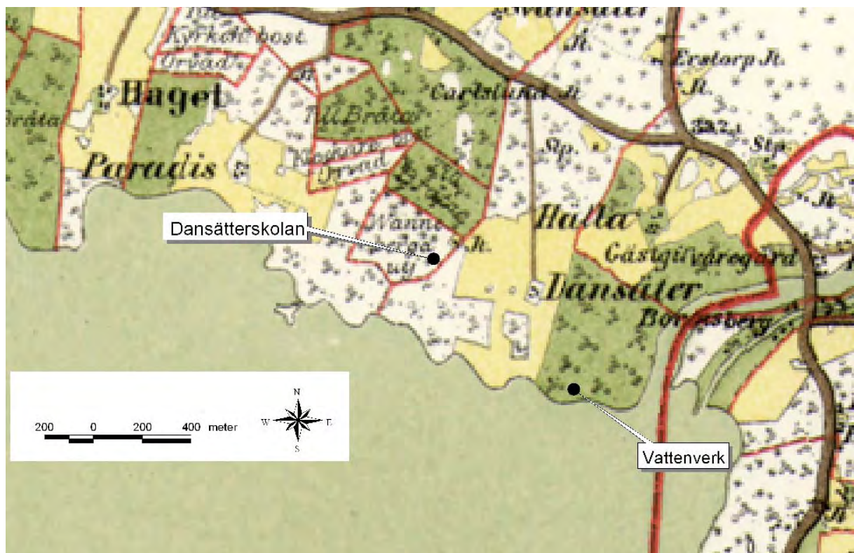
Häradskarta från 1878. På kartan är två nutida byggnader markerade för att underlätta orienteringen. Teckenförklaring: vitt = skog, gult = åker, grönt = äng, bollar = lövträd och stjärnor = barrträd. © Lantmäteriet Häradskarta, Bobergs härad 1878.