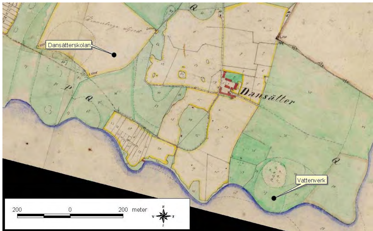
Förrättningskarta från 1883. På kartan är två nutida byggnader markerade för att underlätta orienteringen. Förrättningskarta Dnr: 05kri76