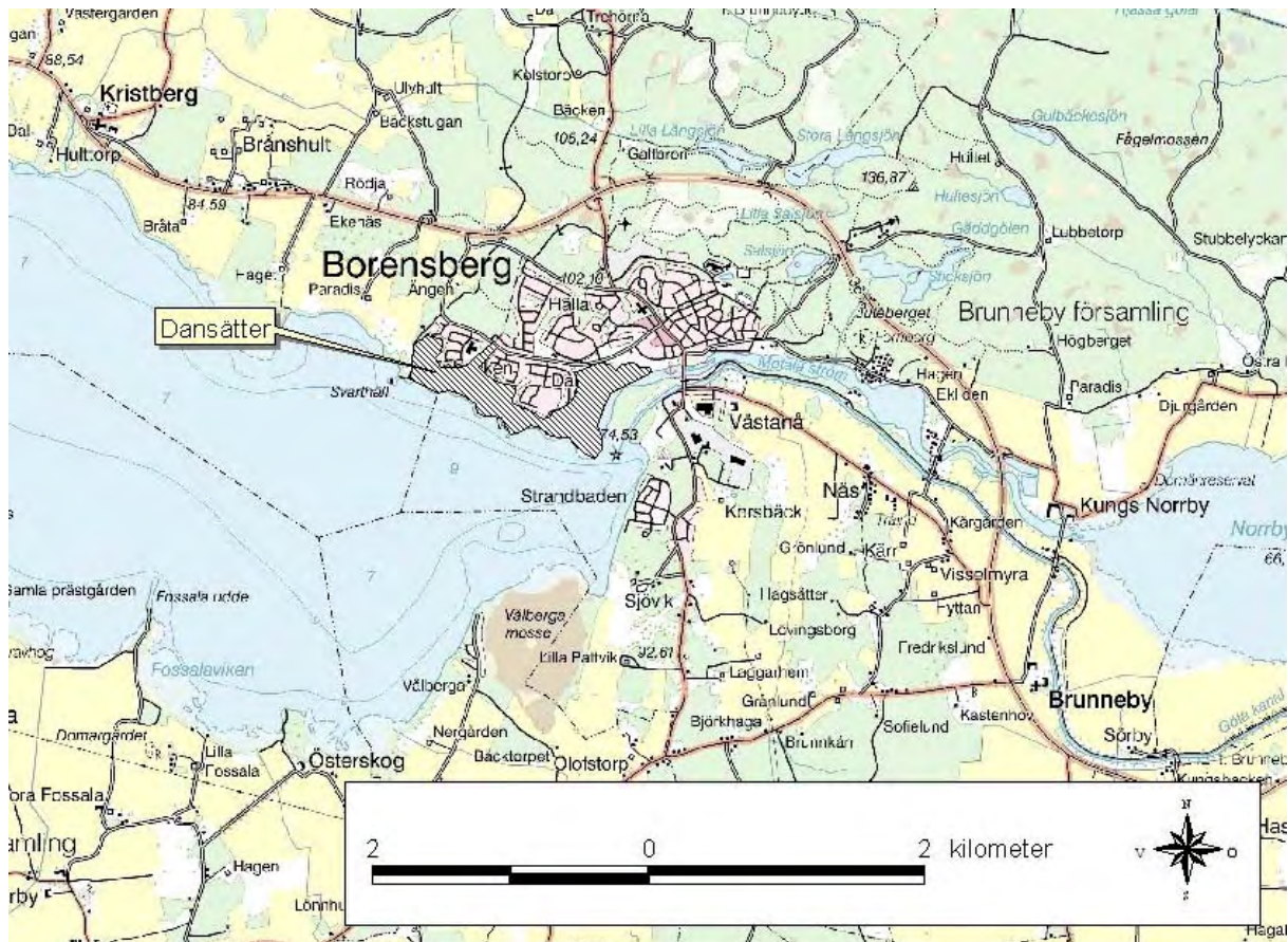
Översiktkarta över Dansätter naturområde. GSD Gröna kartan.