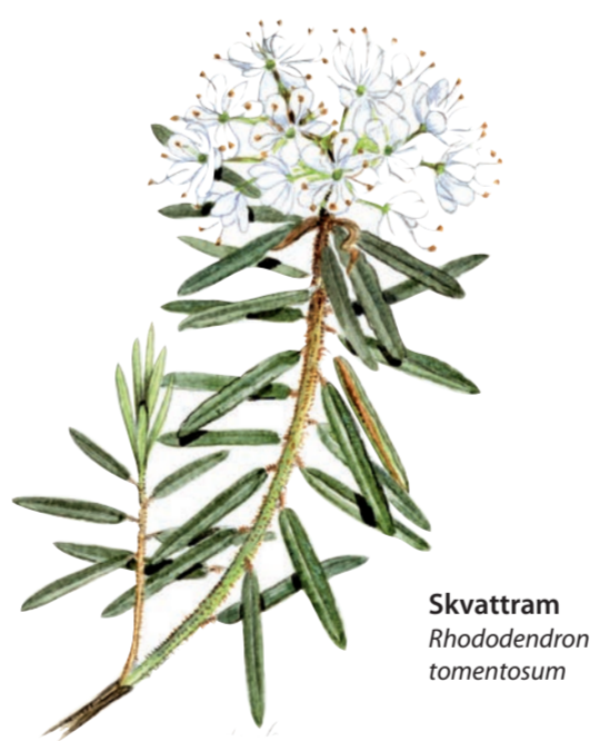
Skvattram Rhododendron tomentosum

På åsen växer nu en granskog och i områdets lägre delar finns tallris-mossar, sumpskogar och en källpåverkad näringsrik granskog.