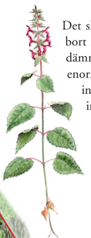
Stinksyska Stachys sylvatica

Det skedde när landisens kant smälte bort från norra Billingen. Issjöns fördämning öppnades och tappades på enorma mängder vatten. Öppningen innebar att havsvatten kunde tränga in i Vätternsänkan.