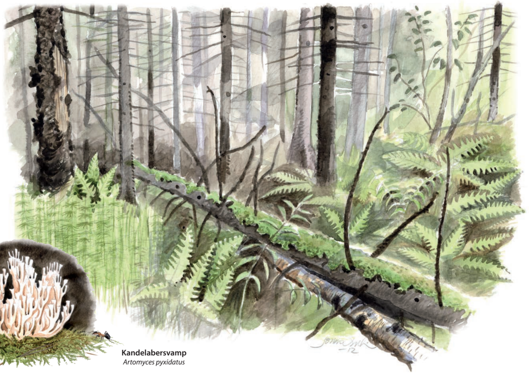
Kandelabersvamp Artomyces pyxidatus

Till de mer sällsynta hör vedtrappmossa, grön sköldmossa och svampen blackticka som växer på murkna gamla granstammar. Den vackra kandelabersvampen kan man ibland se på liggande gamla aspstammar. På tallris-mossarna är det gott om blåbär och där kan du också känna den starkt aromatiska doften av skvattram.