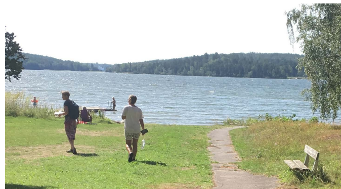
Blåhälls öppna gräsytor, asfalterade stig och en sittbänk på vägen