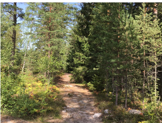
Stigen till Äppelnäsgrund

Du hittar också en grillplats med ved. Grillplatsen har en låg eldstad som är omgiven av stockbänkar.