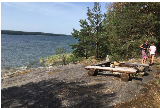
Några av grillplatserna runt Blåhäll.

Från parkeringen går det en asfalterad gångväg mot Blåhäll. Gångvägen är smal och lite ojämn här och var. Parkeringen ligger ca 200 m från Blåhäll. På vägen finns det även några låga sittbänkar utan armstöd.