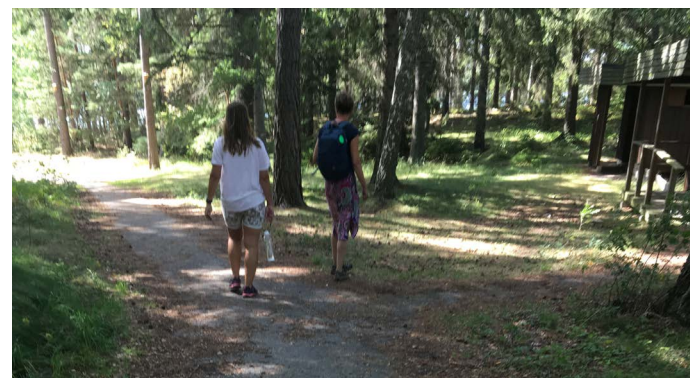
Asfalterade vägen till Blåhäll