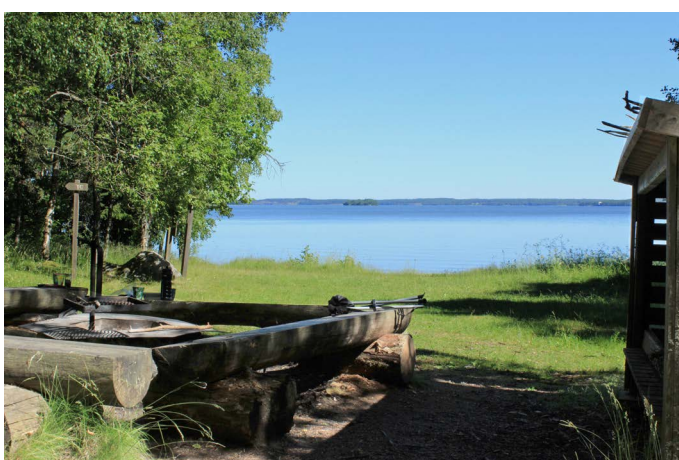
Grillplatsen med grill och stockbänkar

Omgiven av skog ligger den mysiga badplatsen Äppelnäsgrund. Här finns en liten sandstrand och gräsytor för lek och picknick. Bredvid badplatsen finns det en torrtoalett.