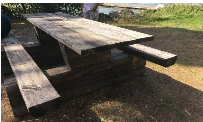
Bänkbord vid stranden, Blåhäll