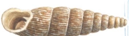
Mångtandspolsnäcka ( Macrogastris plicatula )

Under våren leker strömmingen i Bråviken och Marmorbruket är ett populärt ställe för fritidsfiskare. Högsången är perioden april-början av juni.