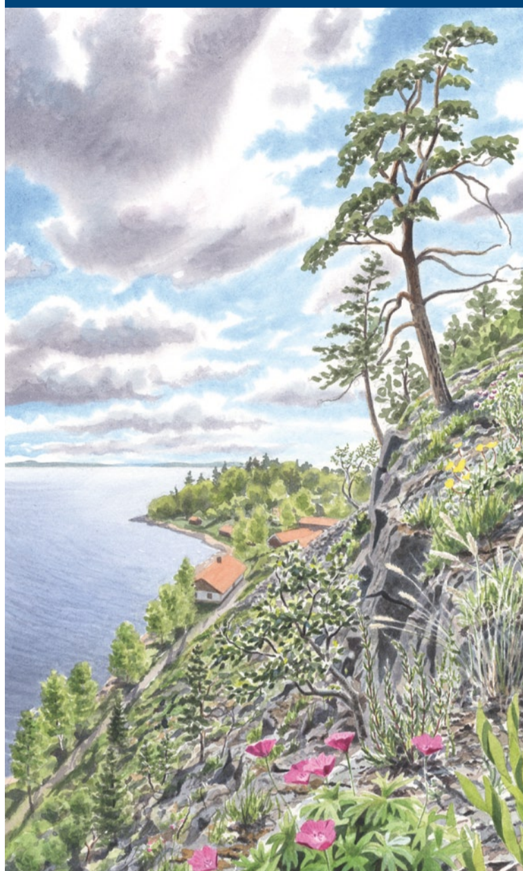
Milljömått trycksak 341.382 Norrköpings Tryckeri AB 2010-03

Marmor är kalksten som omandlats djupt nere i jordkorpan. Från början bildades kalkstenen som avlagringar, sediment, på botten av ett hav. För ungefär två miljarder år sedan veckades jordkorpan och en bergskedja reste sig här. De kalkrika sedimenten pressades djupt ner där de utsattes för högt tryck och hög temperatur, men utan att smälta. Mindre kalkhaltiga sediment omandlades till gnejs, som vi också hittar längs norra Bråvikenstranden.