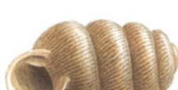
Hedcyliandersnäcka ( Truncatellina cylindrica )