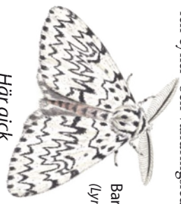
Barrskogsnuuna ( Lymantria monacha )

Stavsjö järnväg, vanligen kallad Nunnebanan, anlades i all hast för att transportera stora mängder timmer, efter att träden dödades av fjärlan barskogsnuuna. Den är i vanliga fall en ovanlig insekt, men som ibland kan förekomma i stora mängder. Vid den aktuella massförekomsten några år kring sekelskiftet 1900 drabbades cirka 3000 hektar skog. Järnvägen var 18 km och slutade i Virå i Sörmland. Den var i drift till 1939 och hade även persontrafik. Idag är den gamla banvallens cykel- och vandringsled.