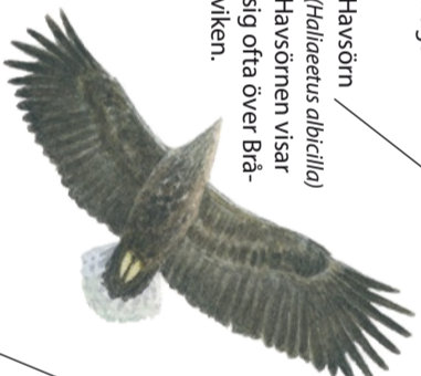
Havsrörn ( Haliaeetus albicilla ) Havsrörnen visar sig ofta över Bråviken.

Det äldsta marmorbruket, Verkstadsbrötter eller "Erran" som det också kallas, är 190 meter djupt! Man har följt marmor ner i djupet, nästan 150 meter under Bråvikens yta. Det säger något om hur attraktiv bergarten tidvis varit.