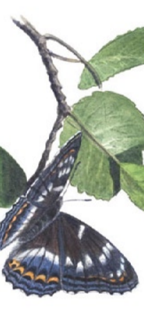
Aspifjäril ( Limenitis populi ) En av våra största dagfjärilar trivs i lövskogen längs Bråviken.

Längs stranden är skogen mycket omväxlande. Ställvis dominerar barskog med inslag av grova tallar. I andra delar längs Kopparbostigen växer lummig lövskog.