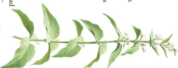
Tulkört ( Vinetoxicum hirundinaria )

I hagmarken norr om pumphuset ligger ett kärr där du kan hitta orkiderna ängsnycklar och tvåblad. De trivs tack vare den höga kalkhalten i marken. Kärr med tydlig kalkpåverkan kallas rikkärr.