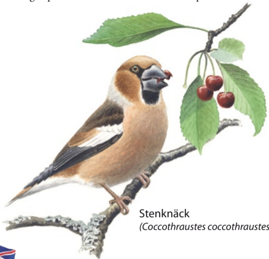
Stenknäck ( Coccothraustes coccothraustes )

Durch den kalkhaltigen Felsengrund und das warme lokale Klima am Südhang hinunter zur Bucht Bråviken gibt es hier ein artenreiches Tier- und Pflanzenleben, das sich von seiner Umgebung unterscheidet. Ein Wanderweg führt in die verschiedenen Teile des Reservates. In der Mitte liegt der eigentliche Marmorbruch um den begehrten Marmorfelsen. Ende des 17. Jahrhunderts begann der Marmorabbau in größerer Skala. Marmor wurde an die königlichen Schlösser in Drottningholm und Stockholm geliefert, aber auch weit weg exportiert, unter anderem an die Oper in Paris.