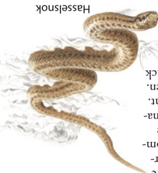
Hasselnok ( Coronella austriaca )

Klippan under dina fötter ser kanske inte ut som ett marmor-golv? Bergsytan utsätts för väders makter och vitnar. För att marmor ska framträda i all sin prakt måste man skapa färska brotytor och polera den. Man kan ju undra hur de upptäckte marmorns skönhet från början?