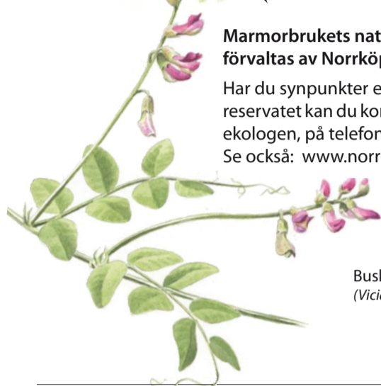
Buskvicker ( Vicia dumetorum )

Marmorbrukets naturreservat förvaltas av Norrköpings kommun. Har du synpunkter eller frågor om reservatet kan du kontakta kommunekologen, på telefon 011-15 00 00. Se också: www.norrkoping.se/natur