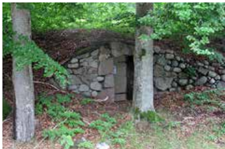
Fladdermuslokal i Växjö.