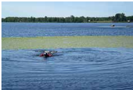
Sjögullsbekämpning i Tingsryd.