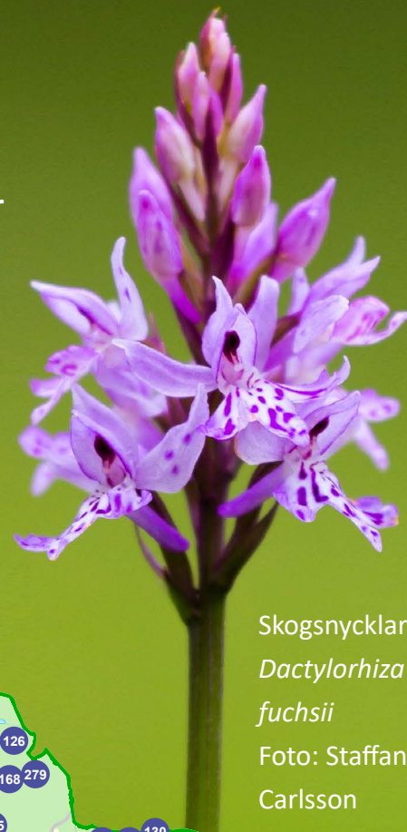
Skogsnycklar Dactylorhiza fuchsii